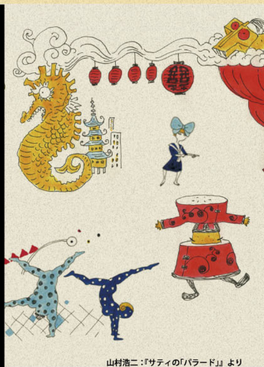
山村浩二：『サティの「バラード」』より