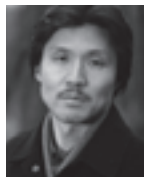
作曲・台本 長田 原 (おさだもと)

仰向けに寝た女が、「死んだら墓の傍に坐って百年待っていてください。きっと逢いに来ますから」と言う。言われるがままに待ち、待ちくたびれて、女にだまされたのではないかと思い始めると、突然百合の花が伸びてくる。