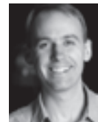
演出 アレック・ダフィー

ドイツ人の父と日本人の母を持つ。著名な指揮者であった父、故・クルト・マズアから薫陶を受け、のちにマンハッタン音楽院とハンスアイスラー音楽大学で学んだ。2011年よりミュンヘン交響楽団首席客演指揮者に就任。現在はボストン交響楽団の副指揮者を務める傍ら、フランス、韓国、ロシア、ドイツなどでも指揮。ニューヨークのチェルシー・ミュージック・フェスティバル芸術監督を務めている。